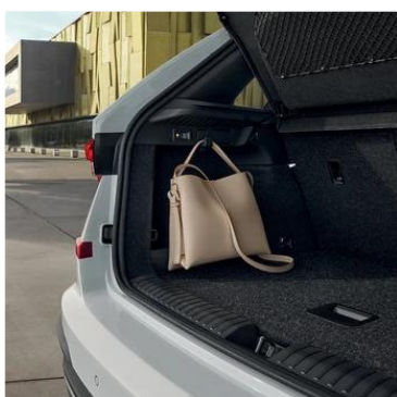
Ganchos para bolsos en el maletero