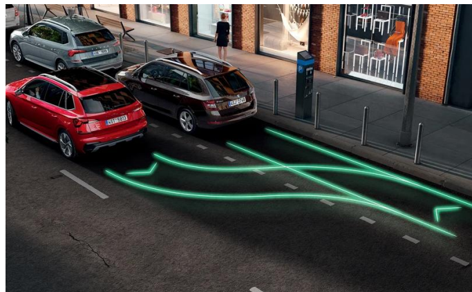
Sensores de estacionamiento delanteros y traseros