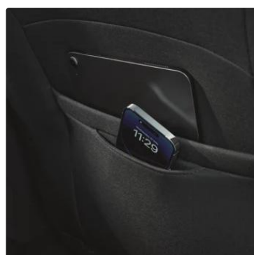
Bolsillos en el respaldo de asientos delanteros